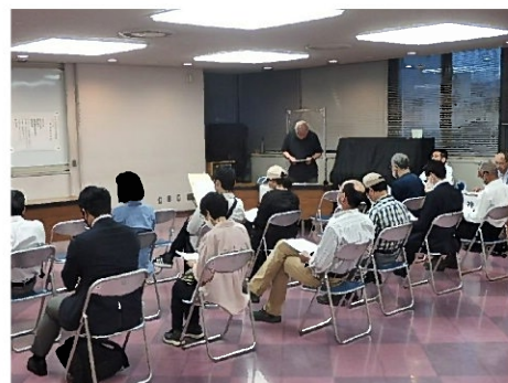
【井澤理事長による開会のご挨拶】