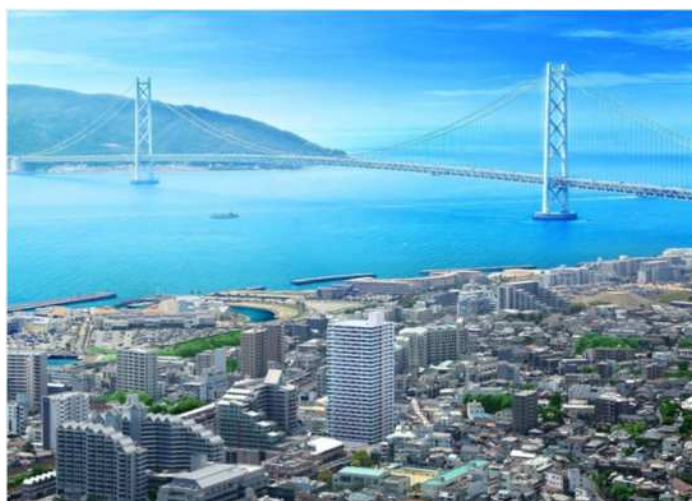
「イメージパース」

組合施行の市街地再開発事業で、施行区域内に土地・建物の権利を有しないが、保留床の取得予定者として市街地再開発事業に参加し、市街地再開発組合の定款で定められた者を言います。（都市再開発法21条）