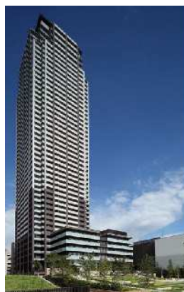
阪神御影駅前南 (御影タワーレジデンス)