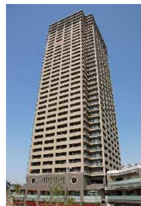
香里園駅東地区 (香里園かほりまち)